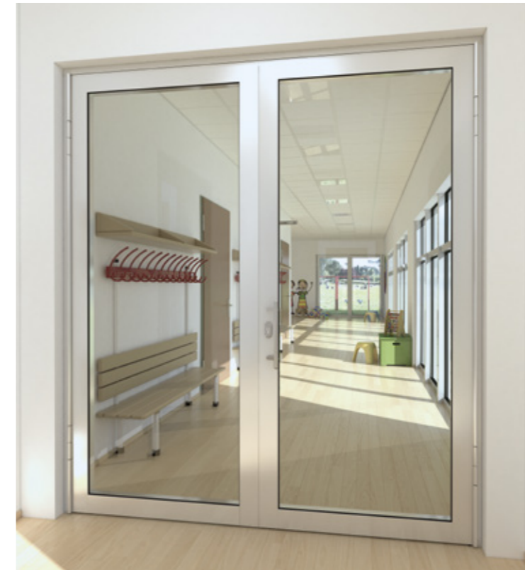
Schüco Tür ADS 80 FR 30 – Fingerklemmschutz für Rollentürbänder Schüco Door ADS 80 FR 30 – Anti-finger trap protection for barrel hinges